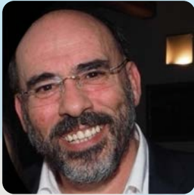
Presidente del Congresso Agostino Inglese

La sterilizzazione dei dispositivi medici riutilizzabili rappresenta uno dei pilastri fondamentali della sicurezza del paziente, un processo complesso e rigoroso che, pur svolgendosi lontano dalla scena clinica, ha un impatto diretto e determinante sugli esiti assistenziali. “Sterilizzazione: un atto invisibile, un impatto vitale” vuole dare voce e visibilità a un ambito spesso sottovalutato, ma essenziale nella catena della qualità e della sicurezza delle cure.